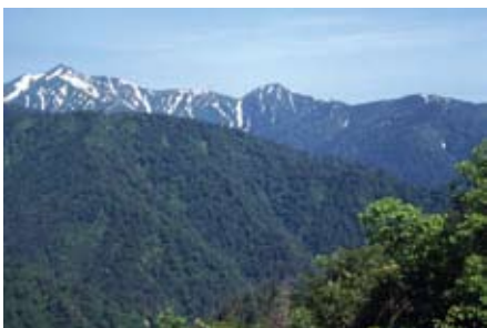
愛染峠から望む朝日連峰

7 月上旬、愛染峠から朝日連峰を見てきました。朝日町には友人も多くよく来ていましたが、こんなに素晴らしい景色が車で行けるところにあるんですね。